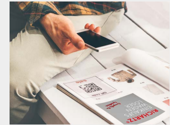
... als Kollektionsartikel