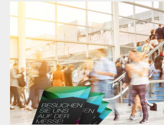
... als Streuartikel