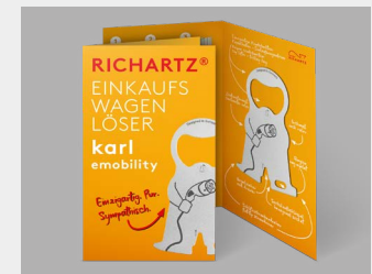
... mit Standardverpackung